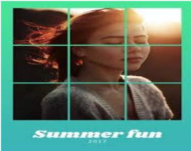
Collage de rejilla